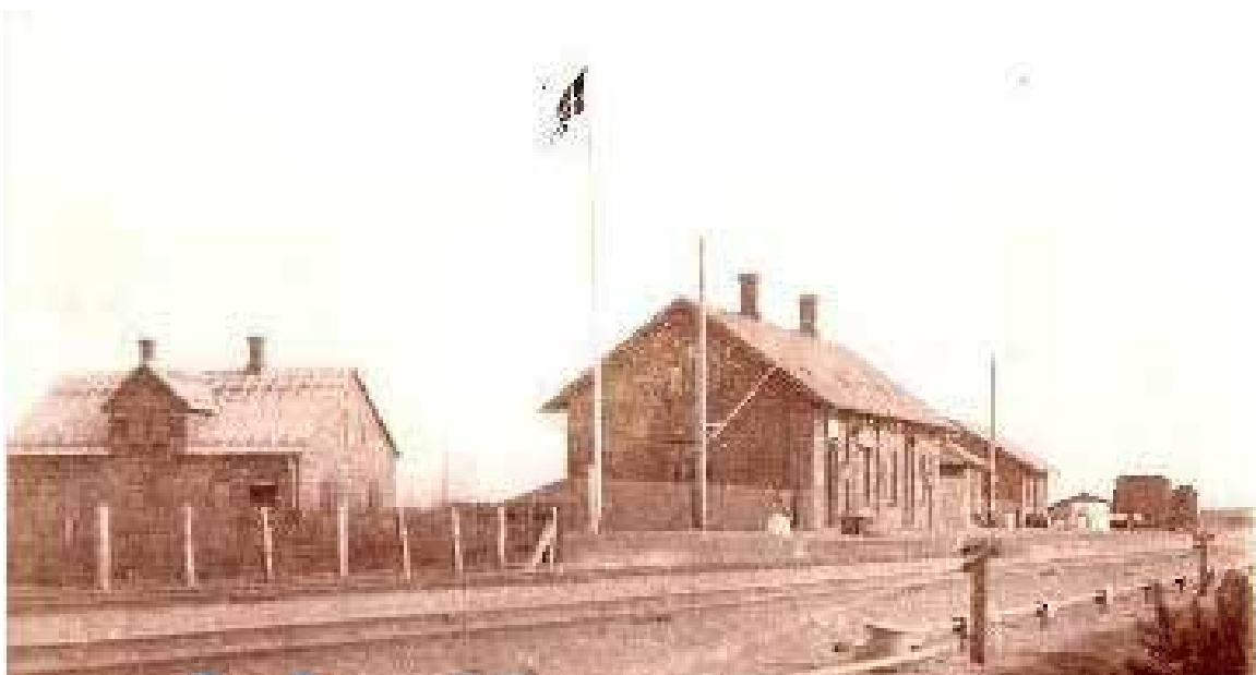
Trinbrættet i 1915.

Nogle af de ældste bygninger i Sig by er Trinbrættet og Sig Kro. Et af de nyere kulturmiljøer finder vi ved Karlsgårde Sø, som man først begyndte at udgrave i 1919 – før det var hele området hede og landbrugsland. I forbindelse med etableringen af søen byggede man Karlsgårdeværket, som på det tidspunkt var Danmarks næststørste elproducerende vandværk. Værket er i dag fredet og udgør sammen med omgivelserne et meget interessant kulturmiljø.